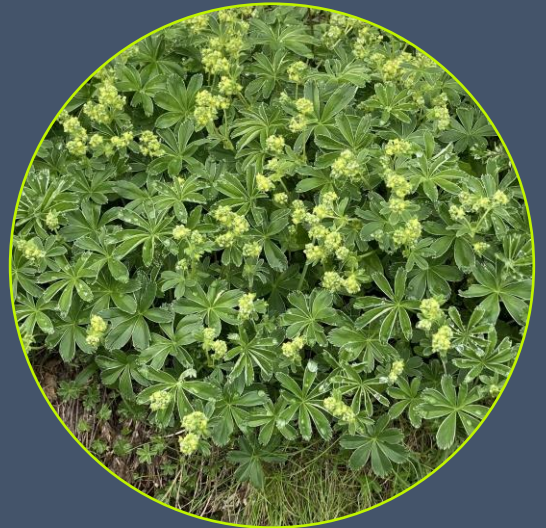
Photo en p. 1 Saas-Fee, S. Eberlé, juin 2023 Photo en p. 2 Adenostyles leucophylla S. Eberlé, Trift, juillet 2023 Photo en p. 3 Ursina en pleine action, U. Studer Photo en p. 3 Xanthium strumarium , C. Blanchon, Vouvry, septembre 2023 Photo en p. 4 Utricularia minor , S. Eberlé, Champex, septembre 2023 Photo en p. 5 Alchemilla glacialis , Gemmipass (VS), N. Künzle

Merci à Niklaus Künzle, grand connaisseur et passionné du genre Alchemilla .